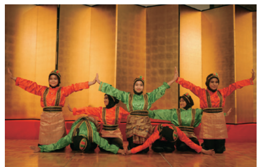
留学生の舞踊「サマダンス」