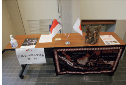
広島インドネシア協会の受付

映画を通じて、多くの方々にインドネシアの暮らしや文化を感じていただける、貴重な機会となりました。