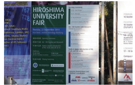
「インドネシアとの連携の歩み」より