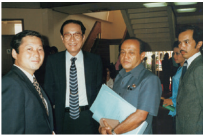
「インドネシアと私」より