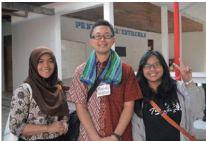
「インドネシアに教えていただいたこと」より