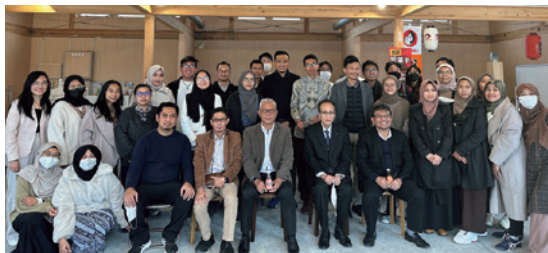
「広島大学とインドネシア留学生」より