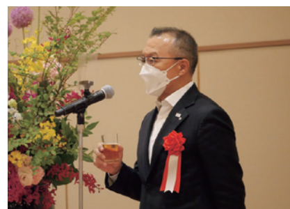
広島県地域政策局 杉山局長の乾杯のご発声