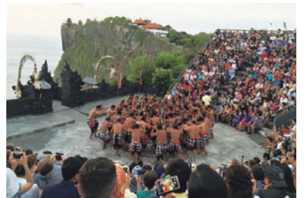
「バリ島滞在記」より