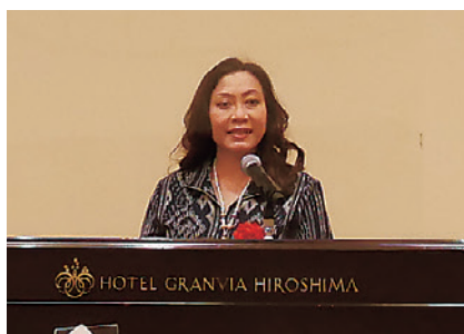
ディアナ総領事のご挨拶

ようやく会員の皆さまと集うことができない、対面で開催できる嬉しさを実感できる機会となりました。