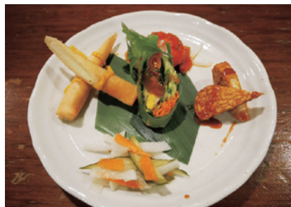
インドネシア料理