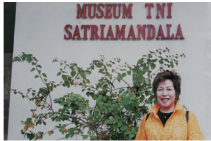
「インドネシア親善訪問団の思い出」より