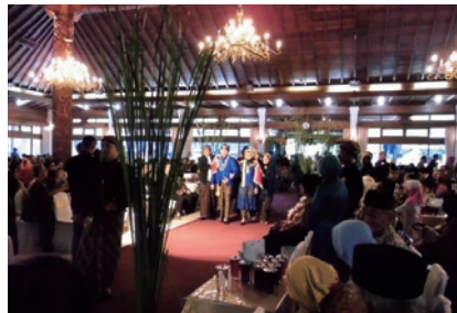
「インドネシア留学生との思い出」より