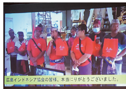
寄附ご活用報告の映像 (広島インドネシア家族会)